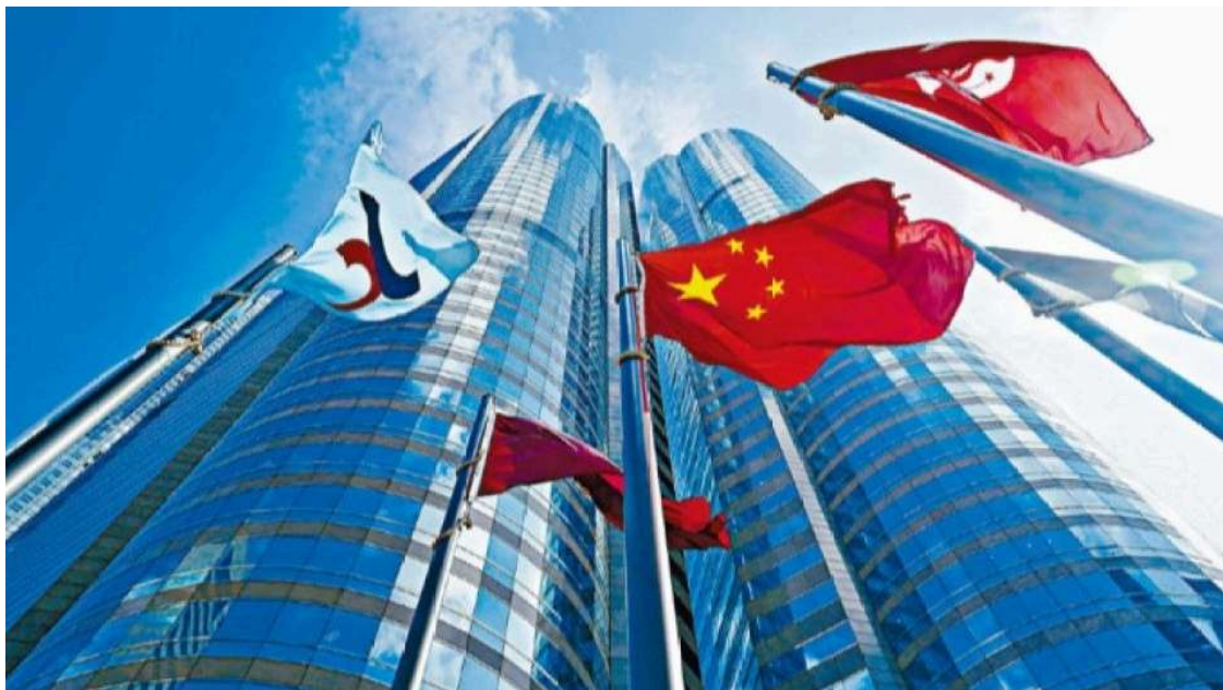
香港應該繼續發展自身優勢，吸引全球投資者和企業來港集資和融資。資料圖片